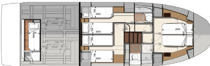
Model available with 3 cabins