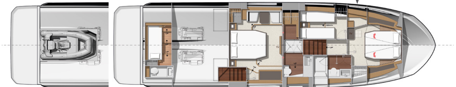
*Model available with tender garage or skipper cabin