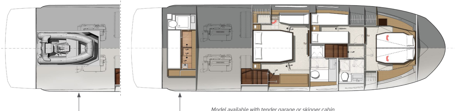
Model available with tender garage or skipper cabin