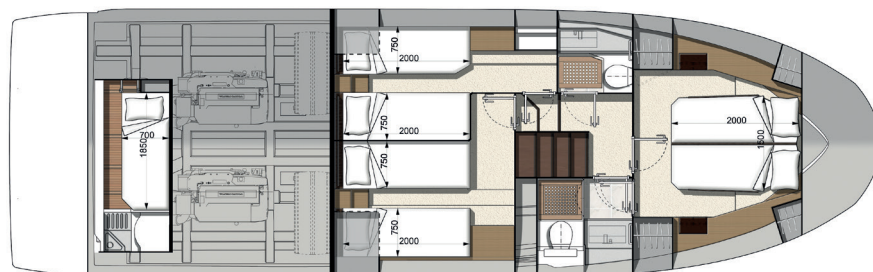
Model available with 2 or 3 staterooms