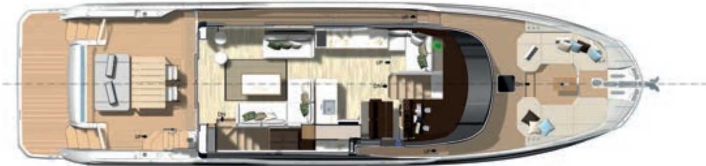
Main deck - Exterior dining version