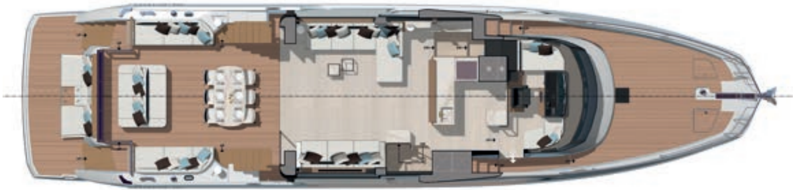
Main deck - Exterior dining version