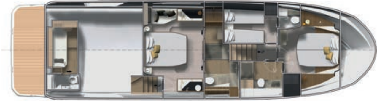
Lower deck - 3 Stateroom 3 Bathroom