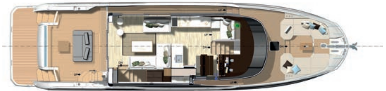
Main deck - Interior dining version