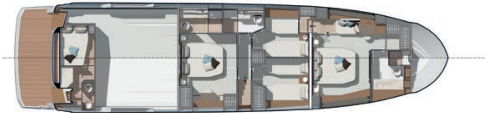
Lower deck - 4 Stateroom version