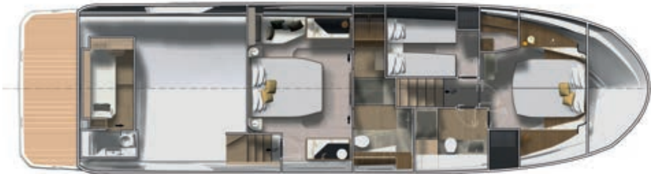
Lower deck - 3 Stateroom 2 Bathroom