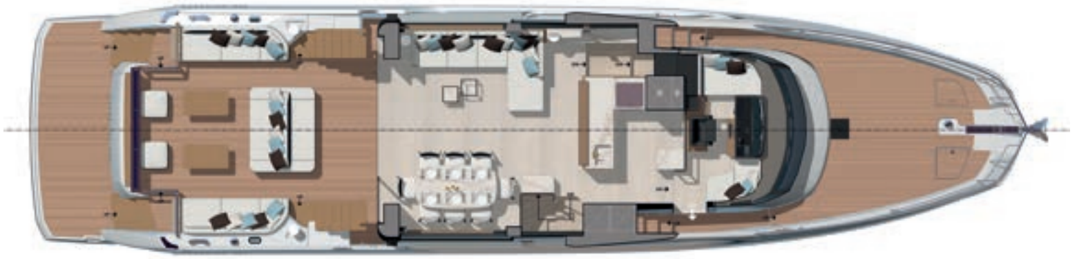
Main deck - Interior dining version