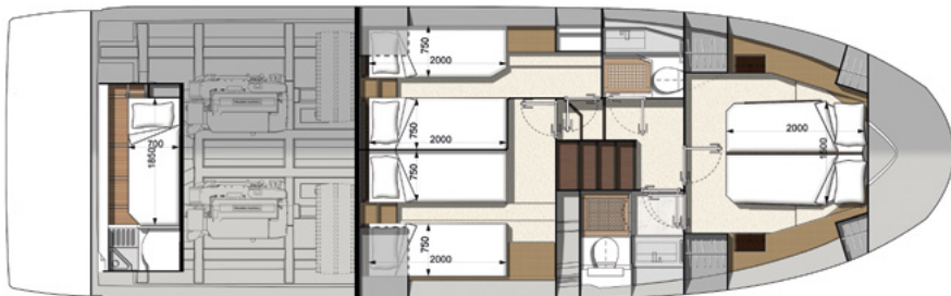
Model available with 2 or 3 staterooms