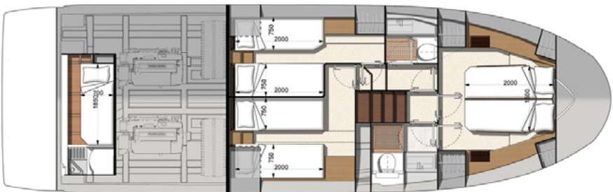
Model available with 3 cabins